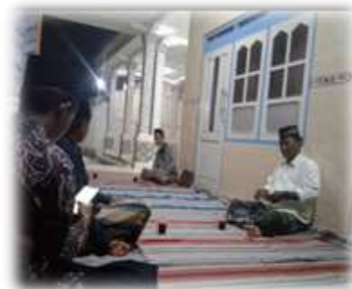
Gambar 1.2 Silaturahmi peserta KKN ke kediaman tokoh masyarakat sekaligus ketua gerakan pemuda ansor

Koordinasi eksternal yang dilakukan antara lain berhubungan dengan aparat desa, tokoh masyarakat dan juga pihak – pihak lain yang bersangkutan.