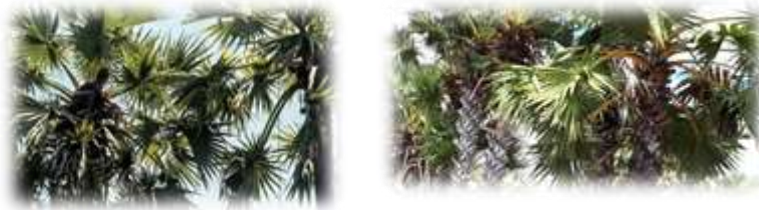
Gambar 1.1 Kondisi lingkungan di sekitar kebun Siwalan

Sebagaimana yang tercermin di Dusun Lembena Desa Bancamara yang masyarakatnya masih menganut nilai-nilai tradisional. Karena masyarakatnya berada di pulau yang begitu terpencil, yaitu pulau giliyang. Pulau giliyang adalah salah satu bagian dari pulau madura yang berada di sebrang timur Kabupaten Sumenep. Meskipun pulau giliyang merupakan bagian dari pulau Madura namun akses menuju kepulauan tersebut begitu sulit karena dipisahkan oleh lautan yang arus ombaknya begitu besar.