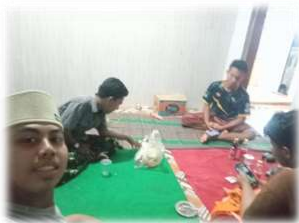
Gambar 1.3 Diskusi Antara Peserta KKN Dengan Tokoh Masyarakat Mengenai Potensi Desa

Setelah mengamati lebih lanjut potensi serta aset yang ada di Dusun lembena ini, berbagai potensi bermunculan. Namun, dengan penuh kesadaran pendamping memahami bahwa dalam waktu yang singkat kami bahwa tidak semua potensi dapat dikembangkan. Menyadari hal tersebut dibuatlah matrik ranking yang bertujuan untuk menentukan potensi mana yang paling tepat dan paling baik jika dikembangkan untuk saat ini. oleh karena itu, pendamping melakukan berbagai diskusi dan mengadakan forum rapat untuk mengetahui potensi apa yang paling ingin dikembangkan oleh tokoh masyarakat dan masyarakat sekitar. Melalui forum tersebut tim pelaksana dapat menyusun matrik ranking untuk mengetahui potensi manakah yang lebih menjanjikan bila dikembangkan. Selanjutnya menganalisa untuk menemukan titik temu dapat dikembangkan dengan cara apakah potensi tersebut.