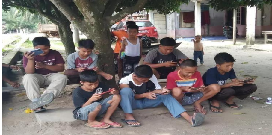
Gambaran pengaruh gadget pada anak masa kini

industri, seperti Internet of Things (IoT), Artificial Intelligence (AI), Big Data, dan robotika, yang berpotensi meningkatkan kualitas hidup manusia.