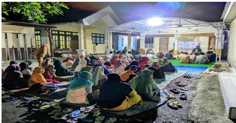
Gambar 1. Sosialisasi Peran Orang Tua dalam membentuk Karakter Anak Era Society 5.0