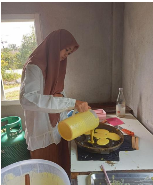
Gambar 2: Pembuatan adonan kue hulu

Kue hulu dikenal dengan nama “ buah hulu ”, Kue turun temurun dari nenek moyang desa santiwit, dengan seiring berkembangnya zaman, kue tersebut sudah hampir punah karena munculnya makanan-makanan baru. Masyarakat desa Santiwit banyak pelaku usaha kue yang masih menggunakan metode tradisional dalam proses produksi, yang sering kali mengakibatkan hasil yang kurang konsisten dalam hal kemasan. Namun, setelah mengikuti pelatihan dan pendampingan, mereka mulai menerapkan teknik baru, seperti penggunaan plastik klip dan logo. Hasilnya, kualitas kue yang diproduksi menjadi lebih cantik sehingga mampu bersaing di pasar yang lebih luas.