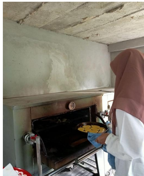
Gambar 3: proses pengovenan kue hulu selama 45 menit

Dalam program dampingan kali ini, peneliti memiliki alasan alasan tersendiri ketika menentukan subjek dan objek dampingan. Termasuk alasan peneliti antara lain sebagai berikut :